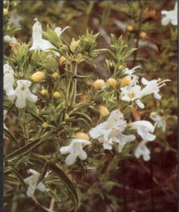
DETALL DE LA FLOR