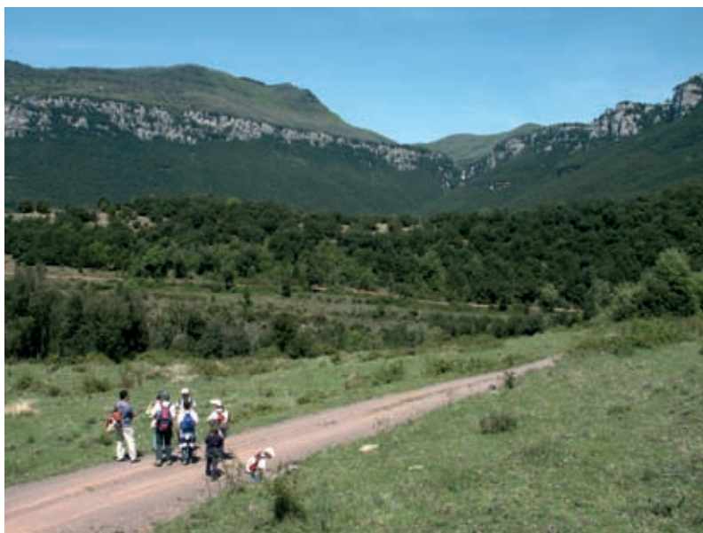
La vall de Fornils, venint de Sant Martí Sacalm

5. Castell de Fornils (4,8 Km - 570 m). Sorprenents restes d'aquest bonic castell, en un