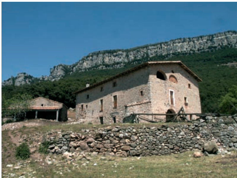
Masia de la Triola, sota els cingles del Far.

per les feixes sense un camí marcat, fins a la casa de la Triola.