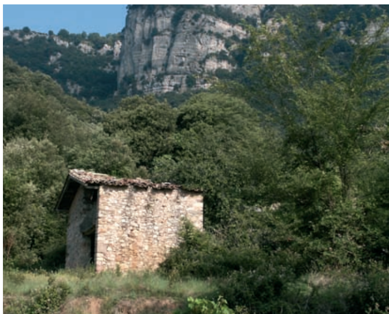
Les Gleies, on comença la pujada del grau de la Casadavall.

7. Grau del Goleró (6,9 Km - 800 m). El nostre itinerari s'endinsa en un alzinar misteriós. El camí està ben marcat i es dirigeix, decidit, cap al fons mateix de la vall de Fornils. Es passa al costat de moltes carboneres antigues. La pujada del grau, amb el bonic camí empedrat i les grosses marrades, és molt emocionant. Es passa molt a prop de la cova d'en Salvi, lloc adient per als amants de l'espeleologia.