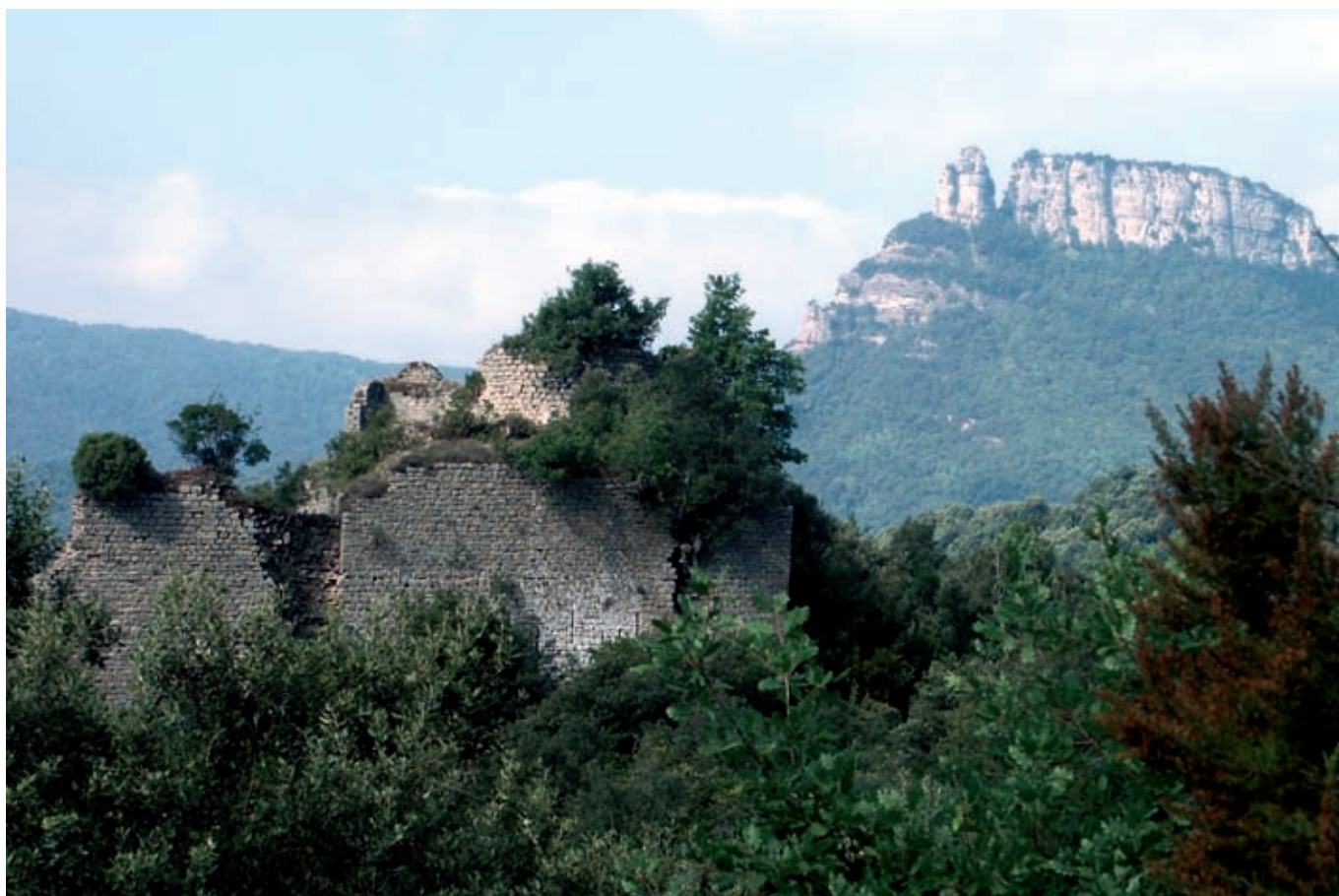
Castell de Fornils, del qual encara queden dempeus bona part dels murs i la torre.

indret tan apartat. Encara en queden restes molt visibles del que va ser el castell de Fornils: parets, restes de les estances i la torre. És esmentat al segle XI i estava vinculat als castells de Fàbregues i de Rupit. Fent una petita grimpada podrem entrar dins la torre, al primer pis, i veure l'estança que hi ha a sota. Tornem a la pista principal, la creuem i pugem,